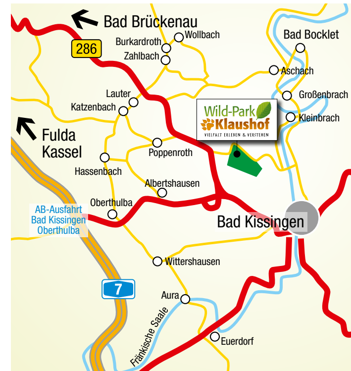
Text: von Dobschütz - DTP, Wolf Scheiner - Stand: 02/18

Haben Sie Lust auf einen erholsamen und spannenden Waldspaziergang auf gut markierten und bequemen Wanderwegen? Dann entdecken Sie im einst königlichen Jagdgebiet die Jahrhunderte alten Baumgiganten und die Urwaldparzelle. Besuchen Sie historische Stätten wie die Wüstung Bremersdorf oder das Kaskadental. Und genießen Sie Ruhe und frische Waldluft.